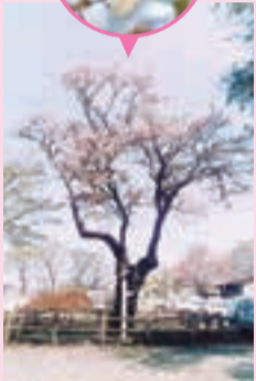
チョウショウインハタザクラ 1996(H8)年撮影

志木第三小学校の西側に、チョウショウインハタザクラと呼ばれる桜の木があります。雄しべの一部が花弁のように変わって「旗」に見えることから、この名で呼ばれます。他に類を見ない世界に一つの品種であると考えられ、平成5年に市指定文化財となり、さらに平成15年に「市民の木」に制定されました。この桜は、樹齢400年以上とされています。江戸時代からずっと柏町の歴史を見守ってきました。