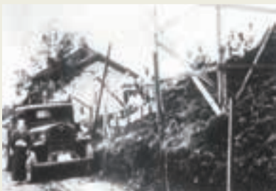
防衛道路工事開始の頃(昭和27~28年)

その理由を調べてみると、志木市は戦後、朝霞・浦和・所沢など占領軍施設を結ぶ交通の要衝に位置していたことから、昭和29年8月、日米行政協定にもとづく『軍用道路』として整備されたので、「防衛道路」と呼ばれるようになったそうです。この道路は正式には一般県道二一三号線(新座川越線)です。