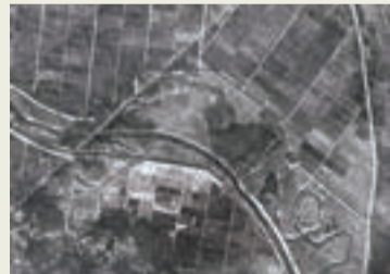
高橋周辺の航空写真(昭和23年) 1948年1月18日