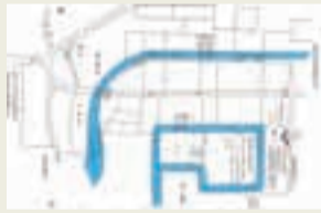
「柏の城」大堀跡の推定図 (志木市教育委員会が「館村旧記」をもとに作成)

また、柏と聞くと柏餅の「柏」を思い浮かべますが、コノテガシワと呼ばれる別の植物に由来するといわれる説もあり、やはり謎が残されています。