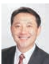
志木市長 香川武文

討を重ねられたと聞いております。そしてこの度、皆様の「絆」を結集して、柏町の魅力がいっばい詰まった素晴らしい情報紙「かしわなほっとぶれす」が創刊となりましたことを大変嬉しく思っております。