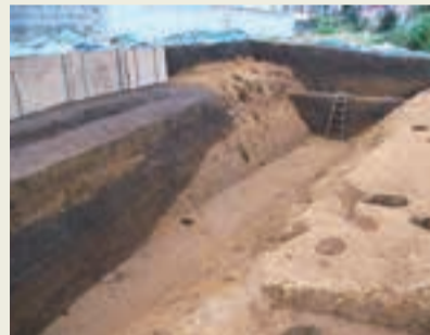
「柏の城」堀跡の発掘調査風景(城山遺跡第71地点)

皆さんがお住まいの柏町、その「柏」の由来をご存じでしょうか。柏町にはその昔、戦国時代の頃に「柏の城」と呼ばれるお城が、現在の志木第三小学校北校舎付近を本丸にして広がっていました。このお城の名前にちなんで、昭和47年に一帯が「柏町」と名付けられました。