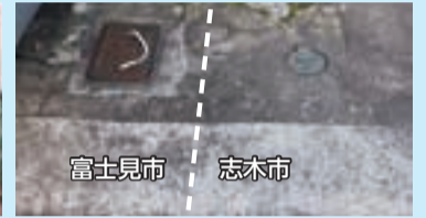
▲志木市と富士見市の境です