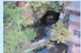
▲隠れ家のようなお庭