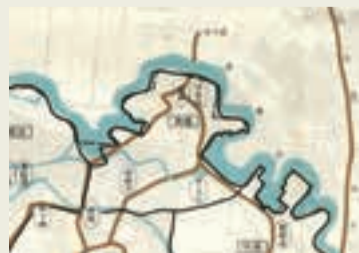
高橋周辺の柳瀬川旧流路と市境 志木市発行「郷土の地名」附録「志木市地名地図」より