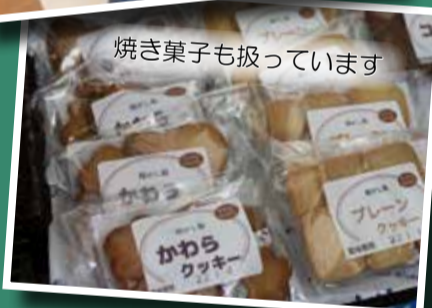
焼き菓子も扱っています