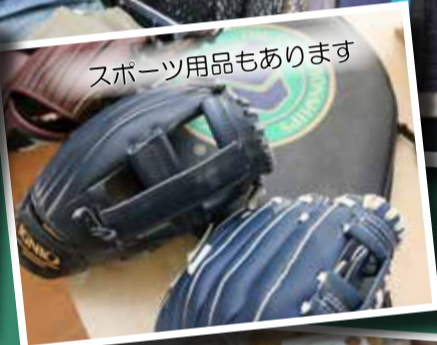
スポーツ用品もあります