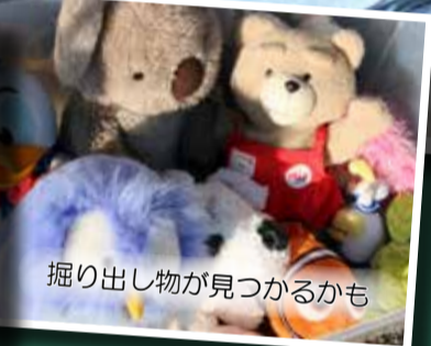
掘り出し物が見つかるかも