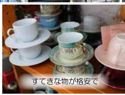
すてきな物が格安で