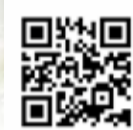
▲志木国際交流会ホームページ

このページでは、柏町にお住まいの方を紹介します。今回はこの方です。田舎お見かけしたら「ほっとぶれす、見ましたよ〜!」と声をかけてみてください。きっと話に花が咲きますよ♡