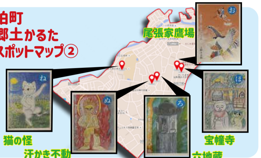
猫の怪 汗かき不動