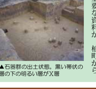
▲石器群の出土状態。黒い帯状の層の下の明るい層がX層