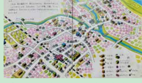
▲「町のはなし」に載っている昭和53年頃の志木市の地図

志木三小の図書室で、ある日「町のはなし」という絵本が目につきました。パラパラとめくってみると、志木市をモデルにした町の成り立ちが描かれたもので、縄文時代から現代までの歴史が語られているとても興味深いものでした。中でも目を惹いたのが、昭和53(1978)年頃の志木市の地図です。 柏町のあたりを目を凝らして見ると、柳瀬川駅がまだ開業前で点線で描かれていたり、市民プールや志木郵便局が柏町にありまして、そして、見慣れない場所に上記の記号が記されていました。今回はここに焦点を当ててみたいと思います。 その記号は、飯田酒店さんのすぐ近くにあった、中道不動堂と呼ばれているお堂でした。このお堂は平成20(2008)年に廃堂となり、その痕跡は何も残っていませんが、気になるのは祀られていた仏像の行方です。 実は、ここに祀られていた仏像は、元々は富士見市の水宮神社(当時は摩訶山般若院という神仏習合の修験寺)に鎮座していたものでしたが、明治維新の神仏分離令により、仏像、仏具類が移管されてきたものでした。廃堂になるにあたって、一時は志木市教育委員会の管理下におかれましたが、平成29(2017)年に150年ぶりに水宮神社に戻すこととなりました。そして、令和3(2021)年には、摩訶山般若院六蛙堂を新たに建立し、帰ってきた不動明王、大日如来、役行者座像などが、修復され再び祀られることとなりました。 「町のはなし」の絵図には、他にも富士見橋の先に青果市場が描かれていたり、いくつかあった工場が移転して、今ではマンションになっていたりと、50年の間に柏町の周辺も大きく変わったのがわかります。 ▲「町のはなし」に載っている昭和53年頃の志木市の地図