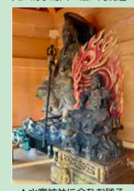
▲水宮神社に今なお残る中道不動堂の不動明王像