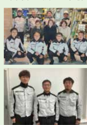
▲左から和孝さん、幸彦さん、幸三さん