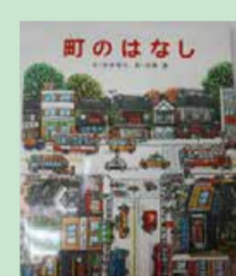
▲「町のはなし」1979年4月ポプラ社刊文/浦水晴夫 絵/高橋透