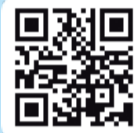
▲Web版かしわなほっとぶれす

平成28年の創刊以来10年にわたり、1月・9月・4月の年3回、タブロイド判でかしわなほっとぶれすを発行してきましたが、昨今の印刷事情の変化に伴い、令和8年12月に発行予定のかしわなほっとぶれす第33号から、A4判8ページにリニューアルすることとなりました。このリニューアルにあわせて、ポスティングによる全戸配布は終了となります。今後は、柏町内の店舗店頭等で配布します。また、Web版かしわなほっとぶれすもスマートフォン情報発信を行うほかアーカイブページも設置し、バックナンバーもご覧いただけます。よりパワーアップしたかしわなほっとぶれすにぜひご期待ください。