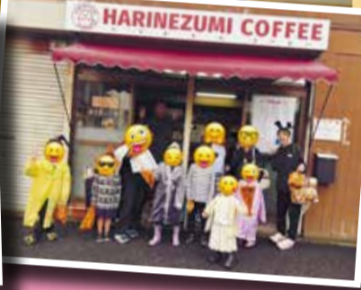
NPO法人そらいろさんとコラボ ハロウィンウォークの子ども達と一緒に