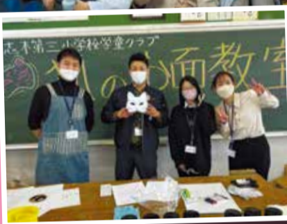
志木三小小学童保育クラブで開催された狐のお面教室